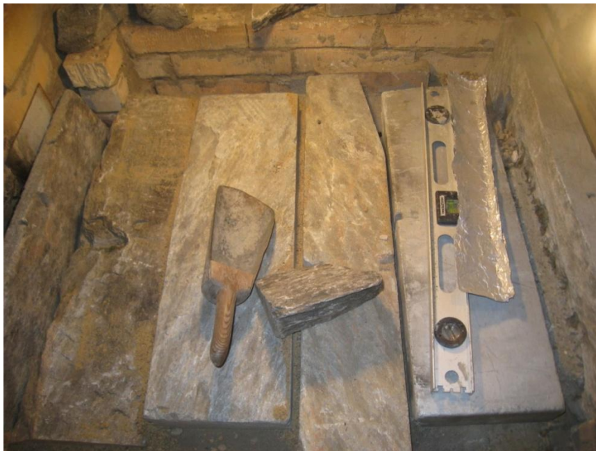
Kansien yläpuolella käytin hyvin varaavia (vuolu)kiviä ja täytin välit irtohiekkalla. Taisin ujuttaa hiekkaan vielä palaneita romurautanauvoja...