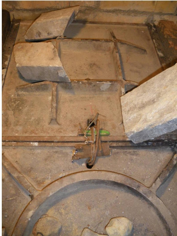
Kaksi kantta on sidottu lujasti toisiinsa. Luukkupuoleinen on kalteva, jotta tuli ohjautuu pesän perälle.