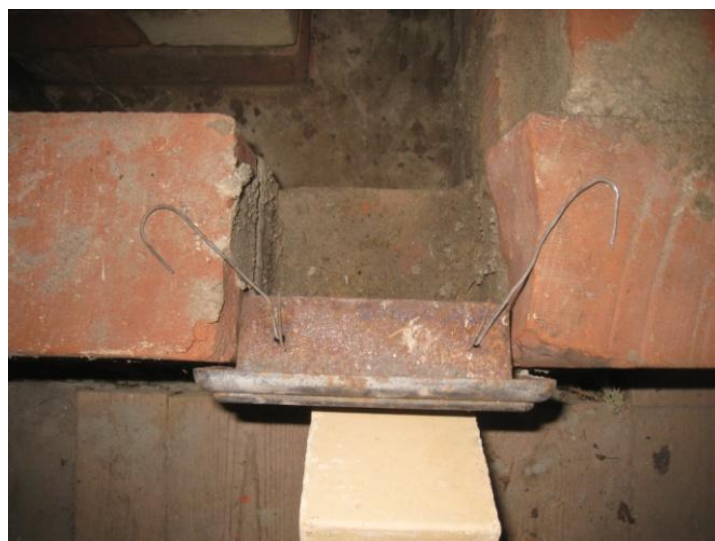
Puhdistusluukkuja kiinnitetään rautalangalla tiilien väliin laastiin

Näkyvässä oleva avoin poikkikanava tuotti veto-ongelmia. Kolmen rinnakkaisen ja epäsymmetrisen kanaviston tasavahvan vedon järjestäminen on itse jo haastava. Myöhemmin erillistin niitä toisistaan ja ne yhdistyvät vasta savupiipun vastaisessa takaosassa (vasen takanurkka).