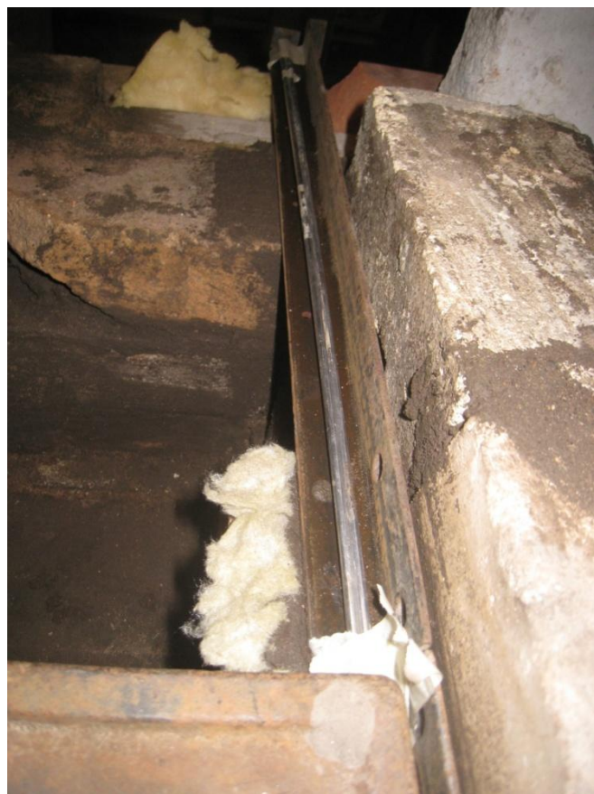
Kiskoilla on pyöreät tangot, jotka toimivat rulla-laakereina raudan laajetessa