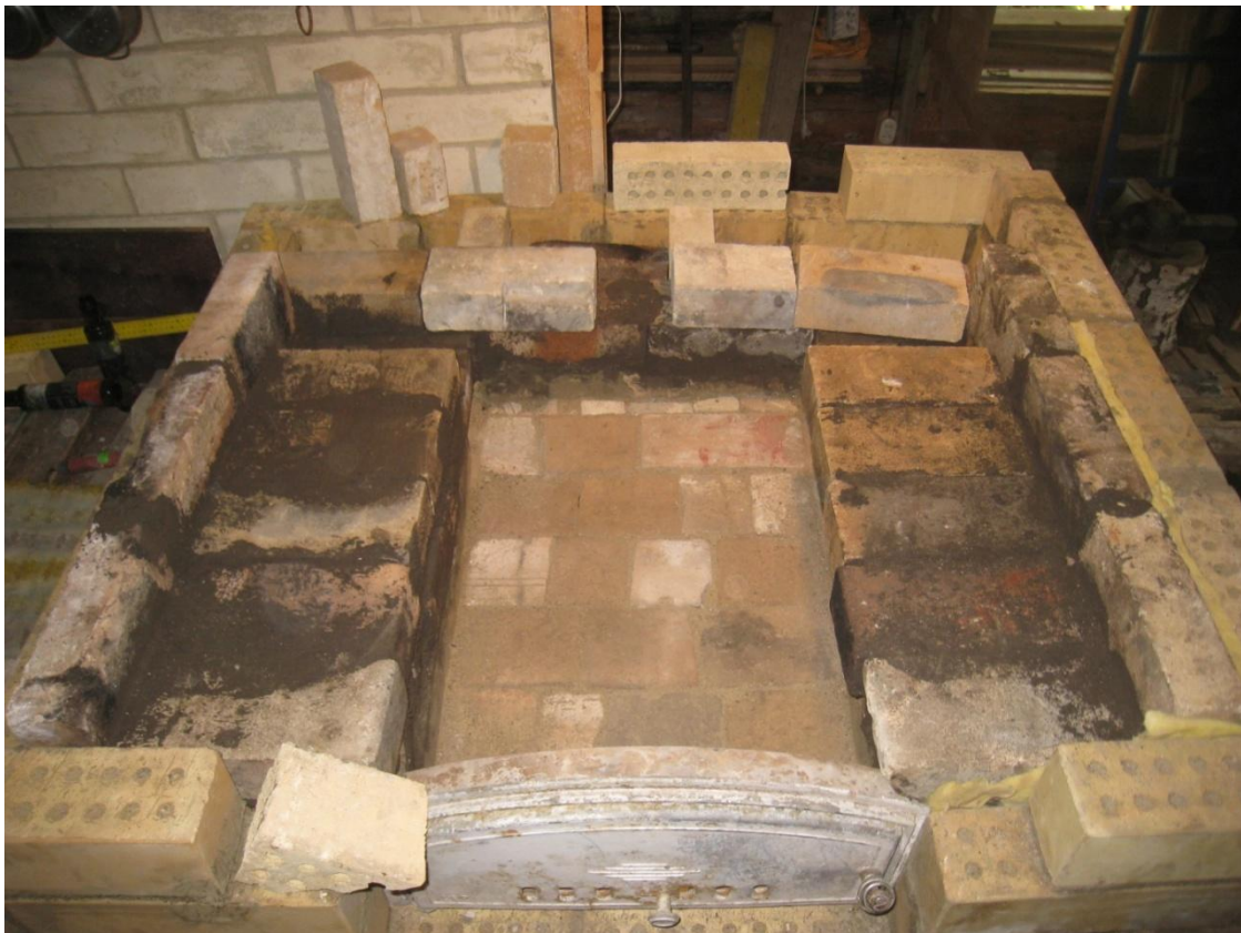
Uunin pohjan olen ladonnut tulikiven palasista ja slammannut savivellillä