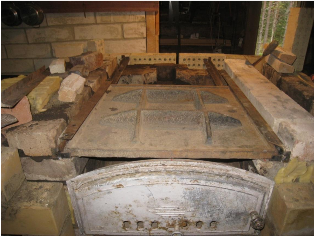
Kaksi viemärinkantta peittävät uunin. Olen toiveikas, että raskas rauta varastoi paljon lämpöä leivontaan.