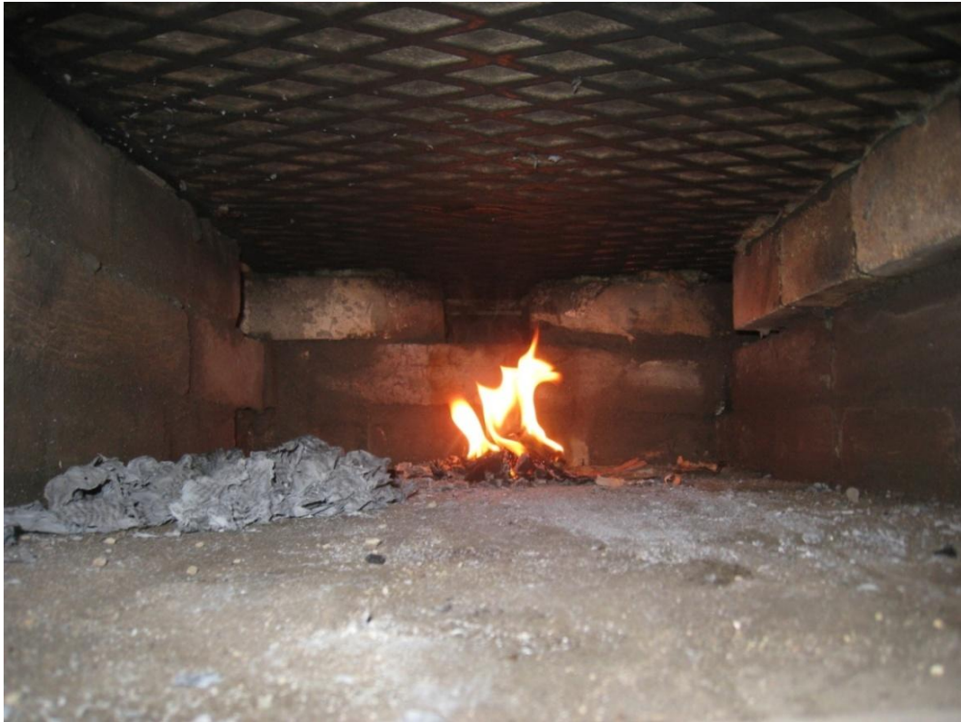
Huoma liekin muodostama kiinalainen koira. Hyvä enne.

Savujen tarkkailuun käytin päiviä. Kokeilin erilaisia lämmitystapoja ja esilämmityksiä. Pitkälle optimoidut rakennelmat toimivat hyvin lähellä rajaa, jonka jälkeen optimointi romahtaa. Siksi itsetekemisessä on mahdollisuus viedä ominaisuuksia pidemmälle kuin kaupallisessa mallissa, joiden pitää ottaa huomioon enemmän erilaisia olosuhteita ja uunin käyttäjiä.