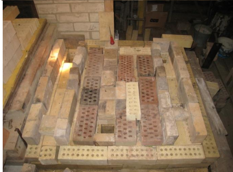
Ensin mallaus, sitten dokumentoitu purku kerros kerrokselta. Kysymyiskohtiin jätin punaisen työkalun merkiksi