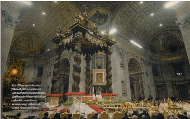
Kristilliset seurakunnat pitävät yllä arvokkaita jumalainpalveluspaikkoja. Vatikaanin Pietarinkirkko on maailman suurimpina sisätiloillaan rakennuksena.

vapaaehtoisesti täyttämättä biologisesti hyvin keskeisen tehtävän: lisääntymisen. Yksilön perimän välittämisen ja lajin ge- neettisen muuntelun kannalta tarkkaisu on luonnossa tällaisen käyttäytymisen voi odottaa onnen pitkää karsitua- van lajikehityksen näkökulmasta tar- kastetuna epätarkoituksenmukaisena.