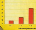
Uskonollisten yhteisöjen elinvoimaisuus vuosina

Hindulaisuuden pohjoista kehittyneimpiä jainalaisia on jumalaton uskonto. Sen harjoittajat eivät palvo mitään korkeinta olentoa.