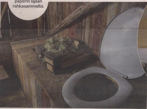
Huuseissa käytetään paperin sijaan rahkasammalta.