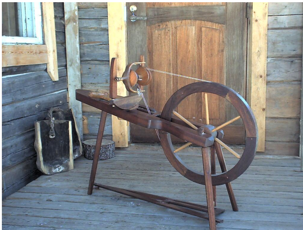
Rukissa ei tarvitse olla yhtään metallia