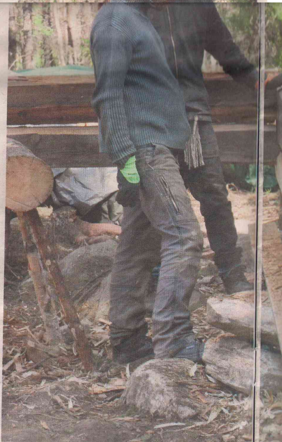
KAINUUN OPISTON ja Omavaraopiston ensimmäinen yhteinen kurssi keskittyy kiksi erilaisiin paikkaustekniikoihin. Hirsityömaalla eivät moottorisahat surise, ihmisvoimalla toimivia työkaluja.