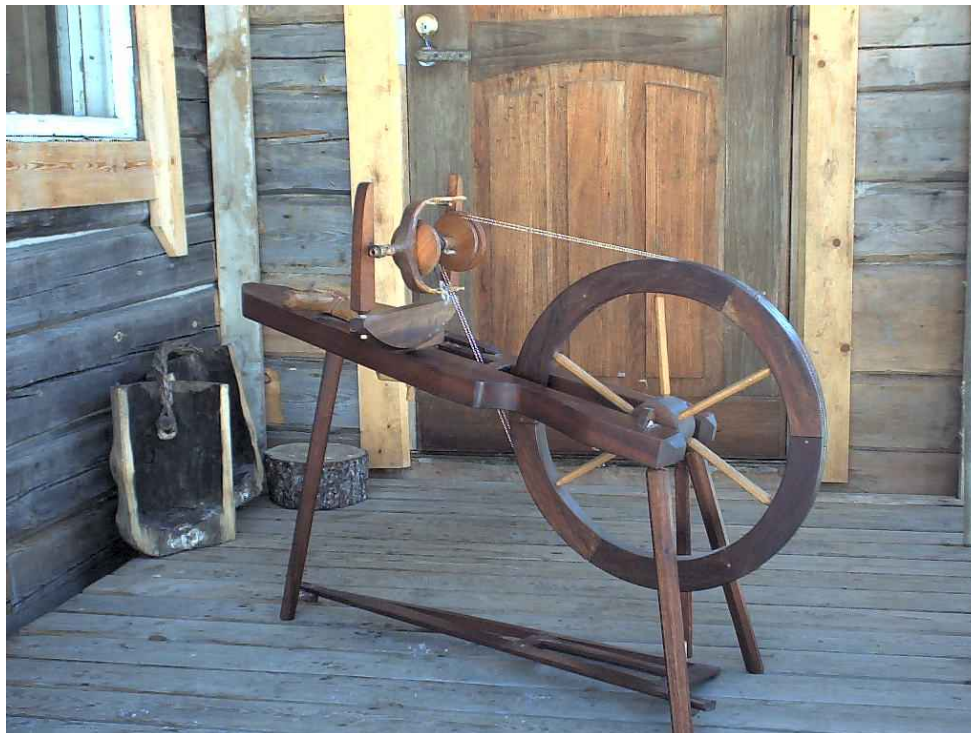
Rukissa ei tarvitse olla yhtään metallia